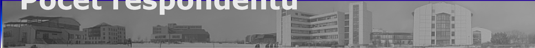
Relativní počet respondentů (%)